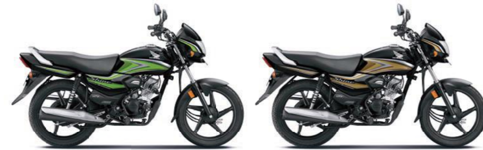
ग्रीन के साथ ब्लैक गोल्ड के साथ ब्लैक