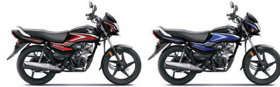
रेड के साथ ब्लैक ब्लू के साथ ब्लैक