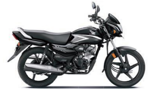
ग्रे के साथ ब्लैक

अभी ऑनलाइन बुक करें! www.honda2wheelerindia.com